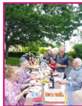
FÊTE DES VOISINS en mai 2018

6 RUE PIERRE PAUL DE RIQUET Réfection des trottoirs côté Montanou ( de la rue de Montanou à la rue de Tuapsé) et de la chaussée de la rue Tolstoï à la rue de Tuapsé (cofinancé avec le quartier 21). À venir en 2019.