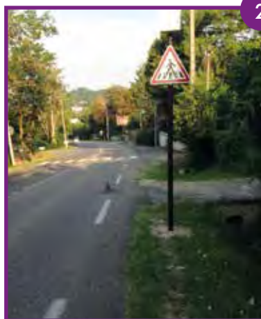
AVENUE DE STALINGRAD Création de 2 passages piétons et implantation de signalétique.