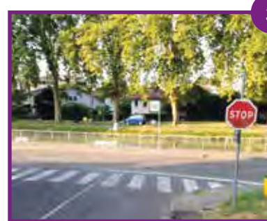
RUE PIERRE PAUL DE RIQUET (sortie rue Bézis) Pose d'un miroir.