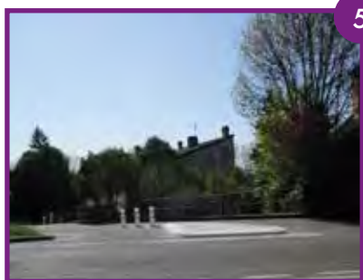
CARREFOUR BÉZIS/STALINGRAD Création d'un îlot.

6 RUE PIERRE PAUL DE RIQUET Réfection des trottoirs côté Montanou ( de la rue de Montanou à la rue de Tuapsé) et de la chaussée de la rue Tolstoï à la rue de Tuapsé (cofinancé avec le quartier 21). À venir en 2019.