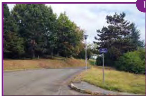
ZAC DE LA MASSE Remplacement des globes d'éclairage.