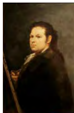
Atribuido a Francisco José de Goya y Lucientes, Autoretrato , 1783, Óleo sobre lienzo, 83 x 56.5 cm © Agen, Museo de Bellas Artes