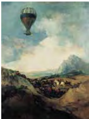
Atribuido a Francisco José de Goya y Lucientes, El balón , después 1824 (?), Óleo sobre lienzo, 105 x 84.5 cm © Agen, Museo de Bellas Artes