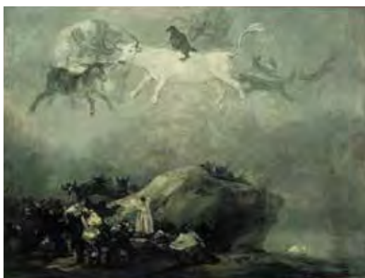
Atribuido a Francisco José de Goya y Lucientes, Escena de caprichos , después 1824 (?), Óleo sobre lienzo, 37.8 x 50 cm © Agen, Museo de Bellas Artes