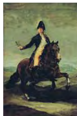
Atribuido a Francisco José de Goya y Lucientes, Retrato ecuestre de Fernando VII (esbozo) , hacia 1808, Óleo sobre lienzo, 42 x 28 cm