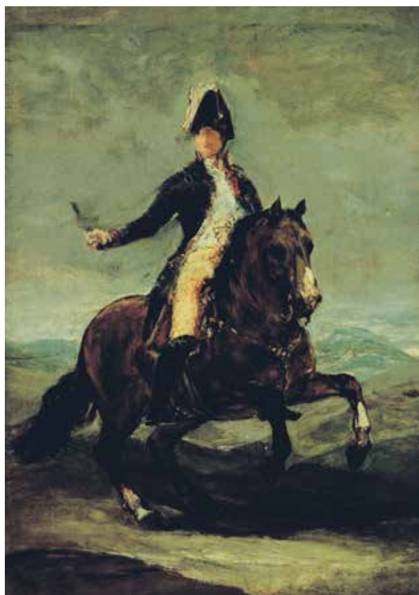
Atribuida a Francisco José de Goya y Lucientes , Retrato ecuestre de Fernando VII (esbozo), hacia 1808, óleo sobre lienzo, 42 x 28 cm

Este proyecto podría, a largo plazo, definir mejor el camino artístico de Goya y la implicación de sus colaboradores en su taller. Nuestra intención es de presentar tanto al público como a los especialistas en pintura española una ocasión única de tener una mirada inteligente y objetiva sobre las obras presentadas, con los análisis técnicos y documentación disponibles.