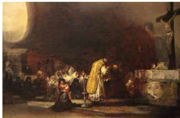
Atribuido a Francisco José de Goya y Lucientes, la misa , hacia 1819, Óleo sobre lienzo, 53.7 x 77 cm © Agen, Museo de Bellas Artes