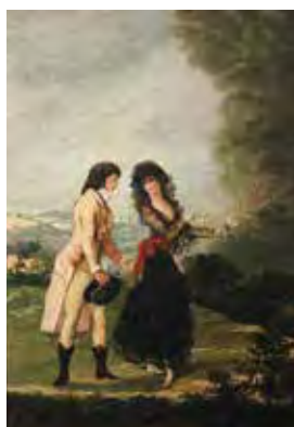
Atribuido a Francisco de Goya y Lucientes, La Pareja elegante (copia del cuadro Coloquio elegante 1793-1797), Óleo sobre lienzo, 55 x 39.6 cm