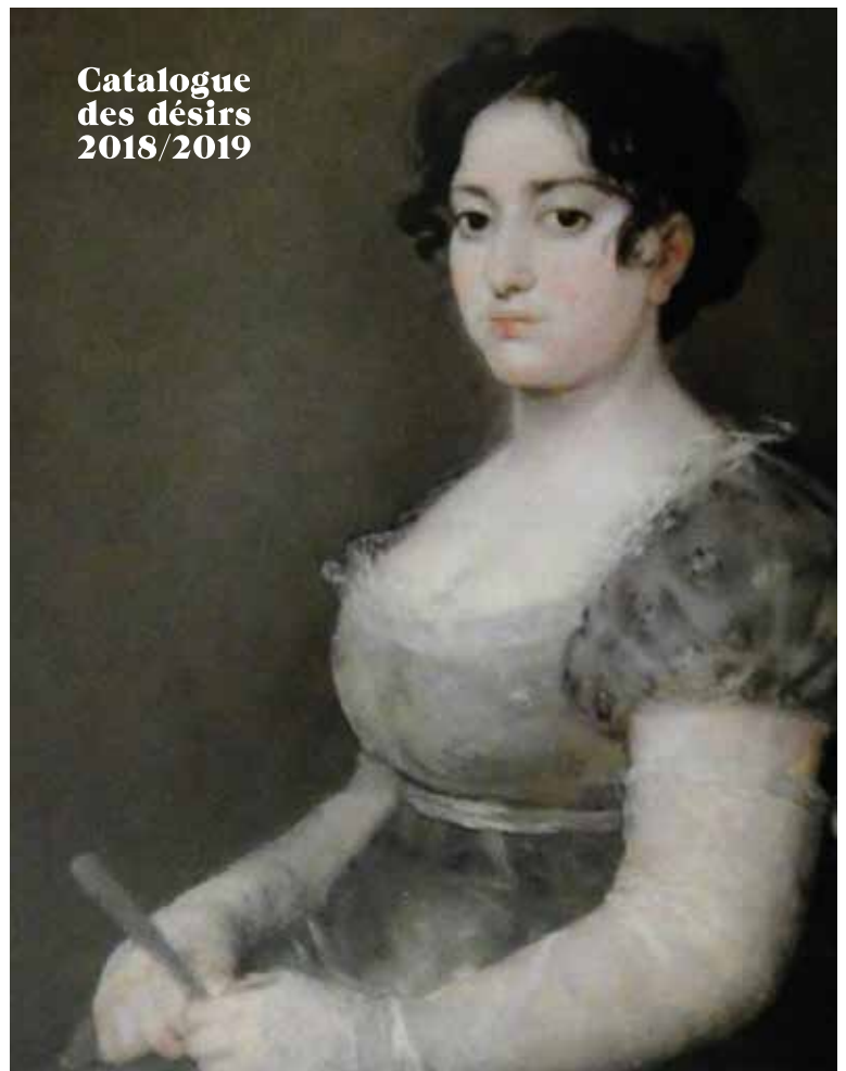
Francisco de Goya y Lucientes La mujer del abanico, hacia 1805-1810

Dentro del Catálogo de los Deseos, un dispositivo elaborado para facilitar la circulación en Francia de las obras mayores de las colecciones francesas, el museo de Agen ha sido designado como museo piloto. Tiene el honor de presentar al público "La Mujer del abanico", famoso cuadro de Francisco de Goya y Lucientes prestado por el museo del Louvre desde el 27 de abril 2019.