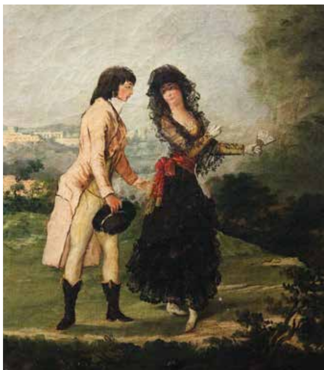
Atribuida a Francisco de Goya y Lucientes, La pareja elegante (copia del cuadro El coloquio galante 1793-1797), óleo sobre lienzo, 55 x 39.6 cm