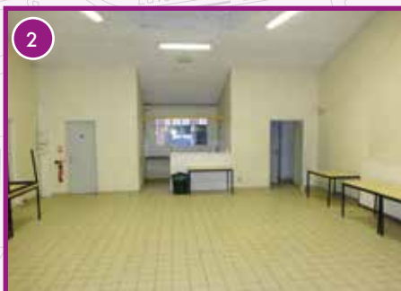
SALLE DE BARLETÉ : Participation à la rénovation de la salle (photo prise avant travaux).