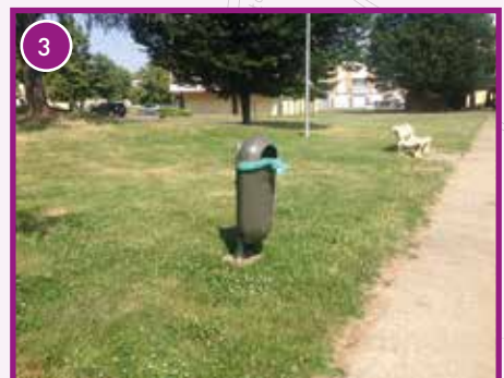
CITÉ DE BARLETÉ : Pose de corbeilles.