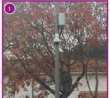
AVENUE DES JARDINAILLES (PLACE DES VIGNES) : Installation d'une caméra.