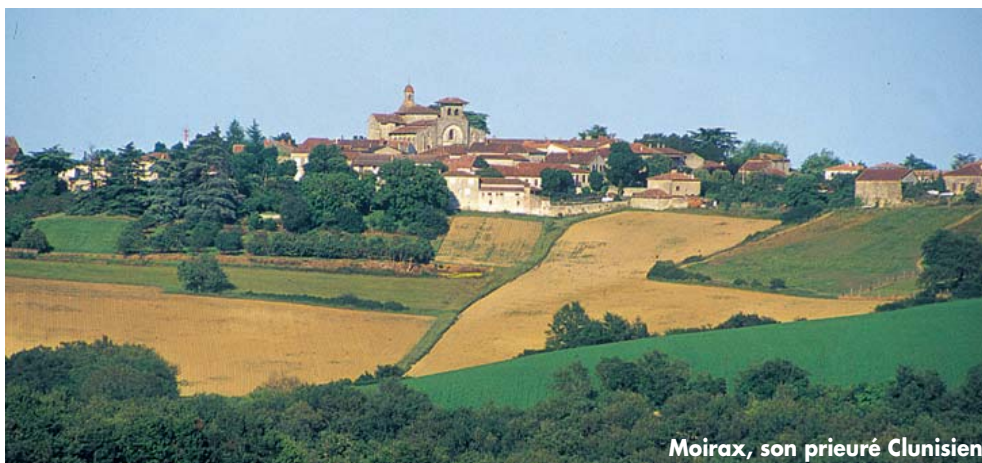
Moirax, son prieuré Clunisien

MOIRAX. Ancien prieuré Clunisien fondé en 1049 par Guillaume-Arnaud de Moirax. Il reste de cette époque des vestiges de son enceinte, une tour de défense et surtout l'église qui est un pur joyau de l'art roman, édifiée sur un plan basilical. Voïr : nef centrale couverte d'un berceau plein cintre, choeur carré couvert d'une coupole sur trompes et abside en cul-de-four flanquée de deux absidioles ouvrant sur les croisillons, chapiteaux historiés. La patine de noyer des lambris et stalles disposés dans la nef se marie harmonieusement avec le ton de la pierre. Plusieurs panneaux sont l'oeuvre du sculpteur Jean Tournier (fin du XVII e siècle).