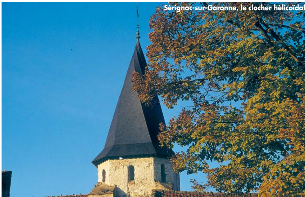
Sérignac-sur-Garonne, le clocher hélicoïdal