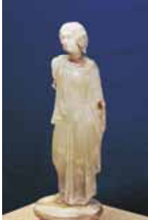
STATUETTE A L'EFFIGIE DE MANLIA SCANTILLA EN VENUS 2 ème SIECLE APRES J.C. Marbre blanc et albâtre, Tayrac