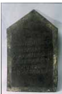
TABLETTE EN BRONZE EN L'HONNEUR DE CLAUDIUS LUPICINUS – 4 ème SIECLE APRES J.C. Fin du 4 ème siècle après J.C. Bronze, Touron (Monflanquin)