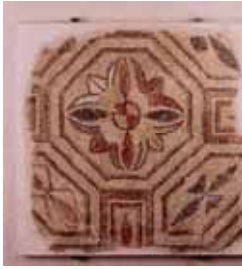
MOSAIQUE POLYCHROME – 1 ER SIECLE APRES J.C Pierre, Agen