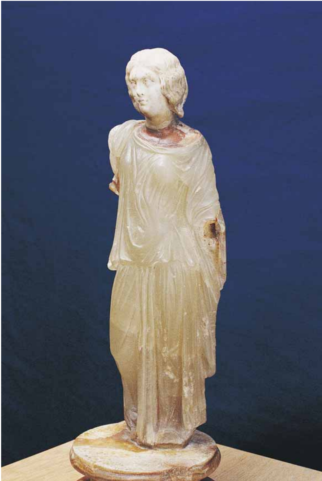
STATUETTE A L'EFFIGIE DE MANLIA SCANTILLA EN VENUS 2 ème SIECLE APRES J.C.

H : 25 cm – l : 9 cm Marbre blanc et albâtre Tayrac