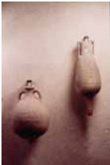
AMPHORES – 2 ème SIECLE APRES J.C. Terre cuite, Ermitage (Agen)