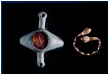
DEUX BIJOUX : BAGUE ET FIBULE 2 ème OU 3 ème SIECLE APRES J.C.