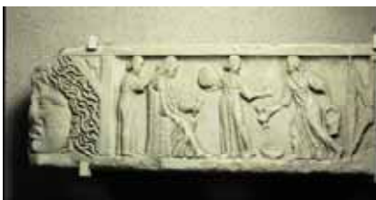
TOILETTE D'UNE FEMME ROMAINE PARTIE DE COUVERCLE DE SARCOPHAGE 4 ème SIECLE APRES J.C. Marbre, St-Hilaire de Lusignan