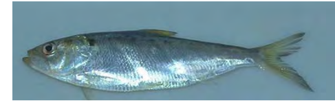
La Grande Alose