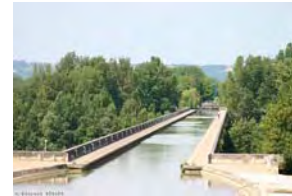
Le pont canal