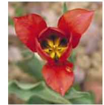
La Tulipe Rouge de l'Agenais

→ Une offre en espaces verts urbains faible : absence d'espace vert public à l'échelle d'Agen