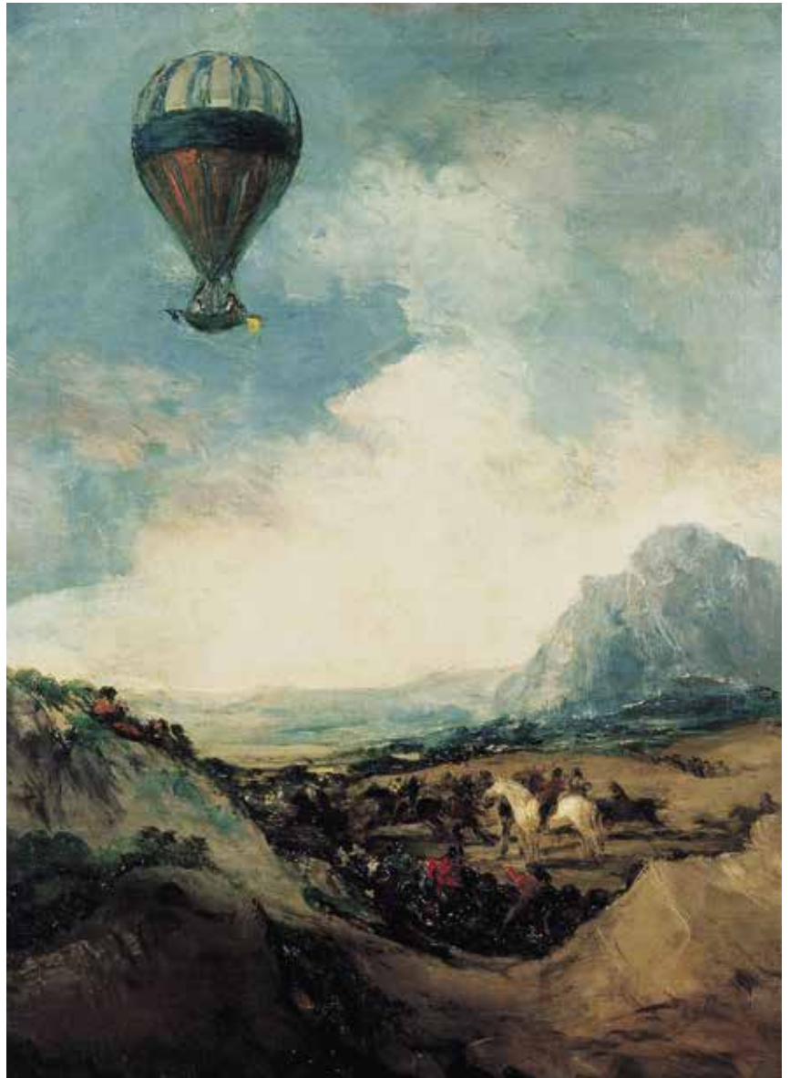
Attribué à Francisco José de Goya y Lucientes, Le Ballon , après 1824 (?), huile sur toile, 105 x 84.5 cm

Près de 90 œuvres provenant de musées du monde entier (Budapest, Suisse, Berlin, Espagne, New-York...) seront réunies dans l'écrin agenais que constitue l'église des Jacobins.