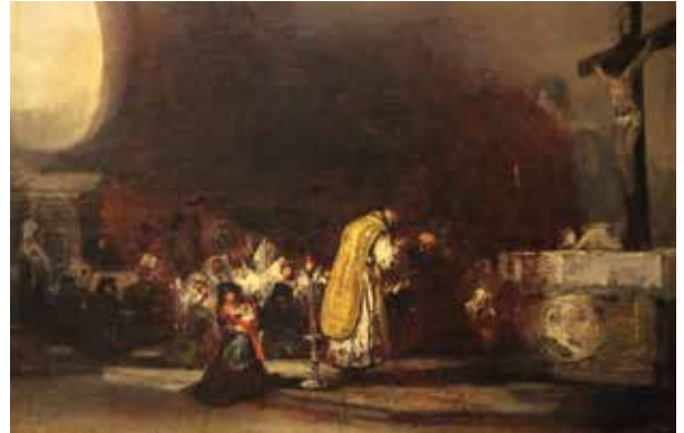
Attribué à Francisco José de Goya y Lucientes, La Messe des relevailles , vers 1819, huile sur toile, 53.7 x 77 cm