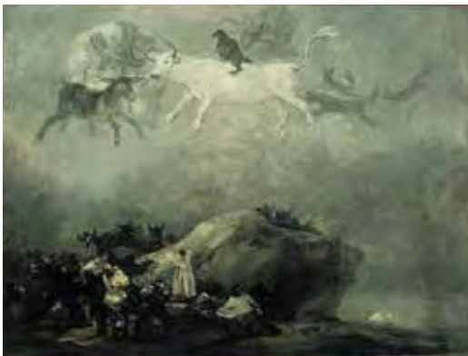
Attribué à Francisco José de Goya y Lucientes, Scène des caprices , après 1824 (?), huile sur toile, 37.8 x 50 cm