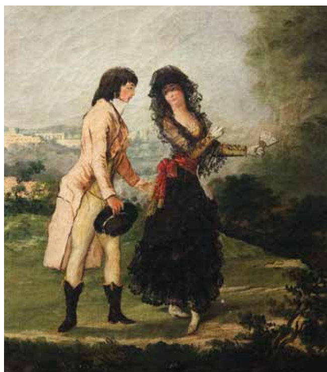
Attribué à Francisco de Goya y Lucientes, Le Couple élégant (copie du tableau Le Colloque galant, 1793-1797), huile sur toile, 55 x 39.6 cm