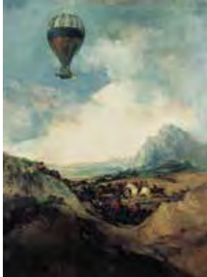
Attribué à Francisco José de Goya y Lucientes, Le Ballon , après 1824 (?), huile sur toile, 105 x 84.5 cm