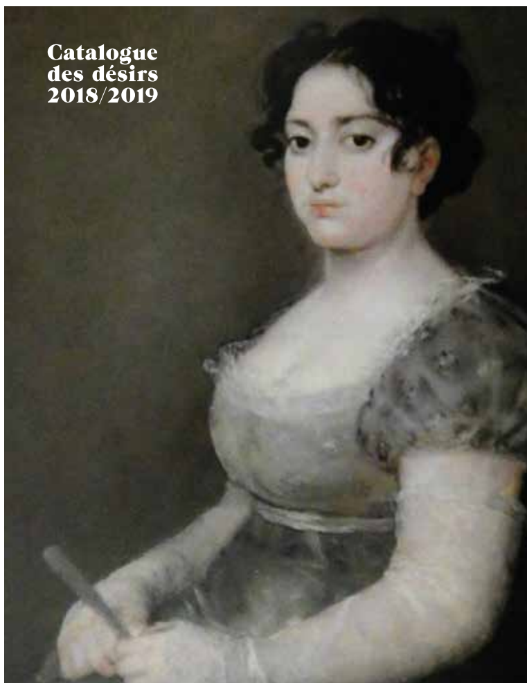
Francisco de Goya y Lucientes La Femme à l'éventail, vers 1805-1810