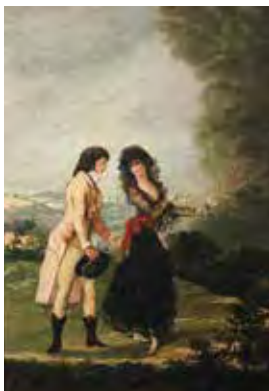
Attribué à Francisco de Goya y Lucientes, Le Couple élégant (copie du tableau Le Colloque galant, 1793-1797), huile sur toile, 55 x 39.6 cm